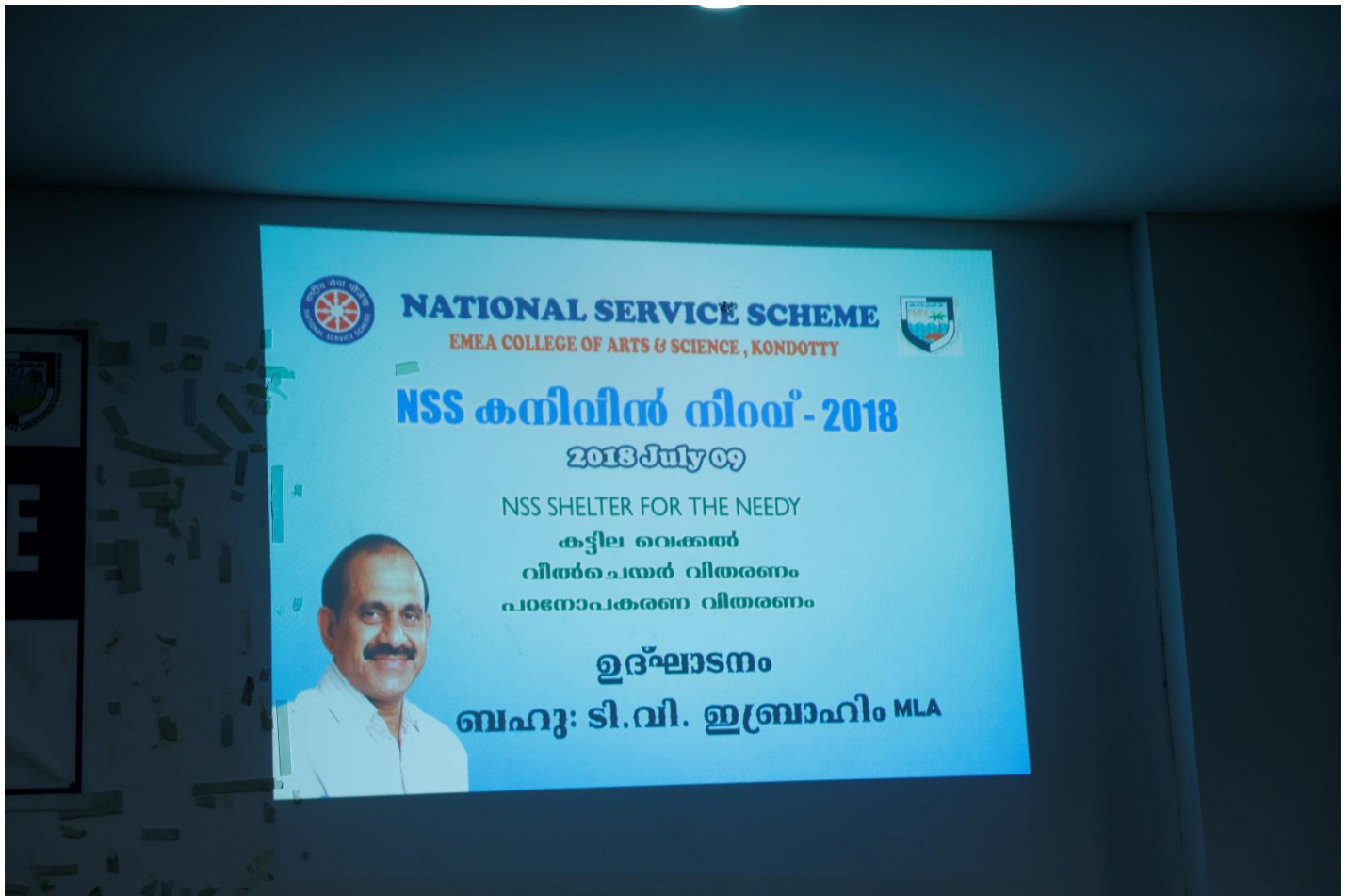
NSS Shelter for Needy Program 2018