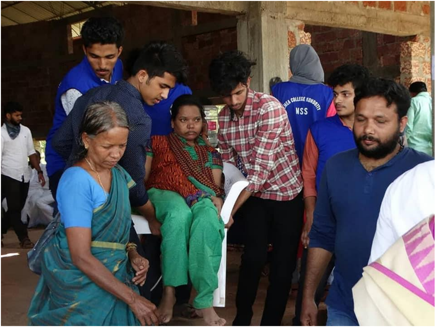
Medical Camp by NSS and SIP 2018